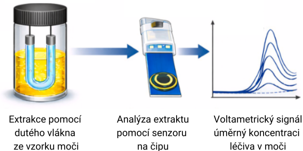
Schéma analýzy léčiva Trazodon v moči