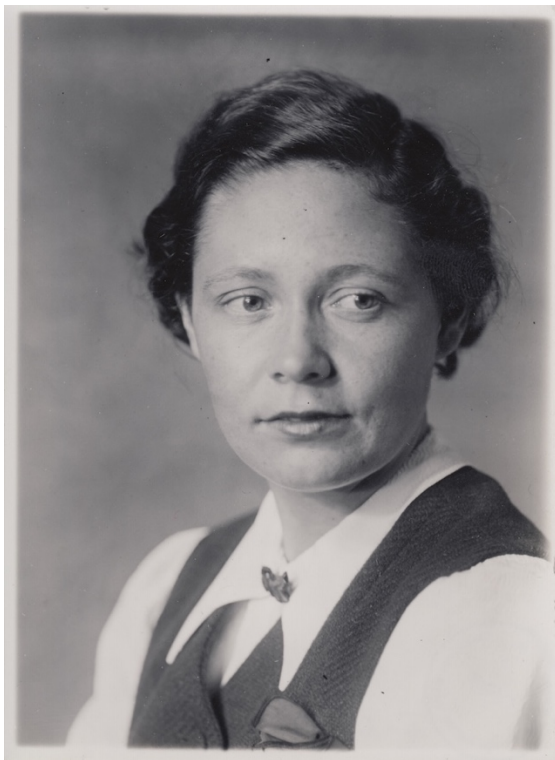
Vítězslava Kaprálová, portrétní fotografie (1938-39)