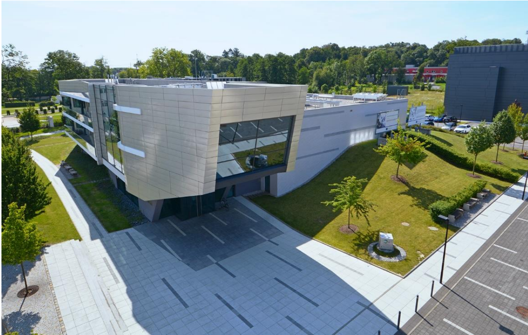
Budova Centra HiLASE v Dolních Břežanech (Fyzikální ústav AV ČR).