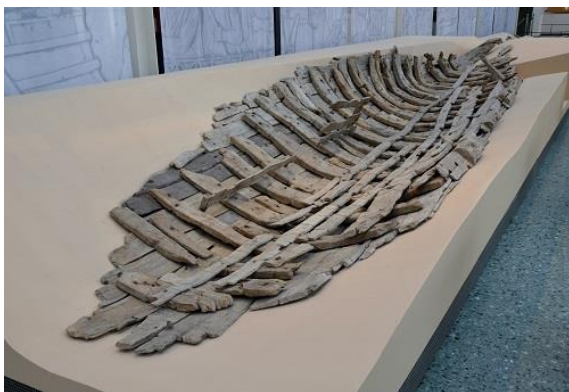
Pozůstatky lodi nalezené v Mainzu, podle kterých byla konstruována replika Danuvina Alacris