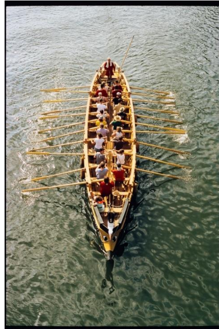
Replika římské lodi Danuvina Alacris