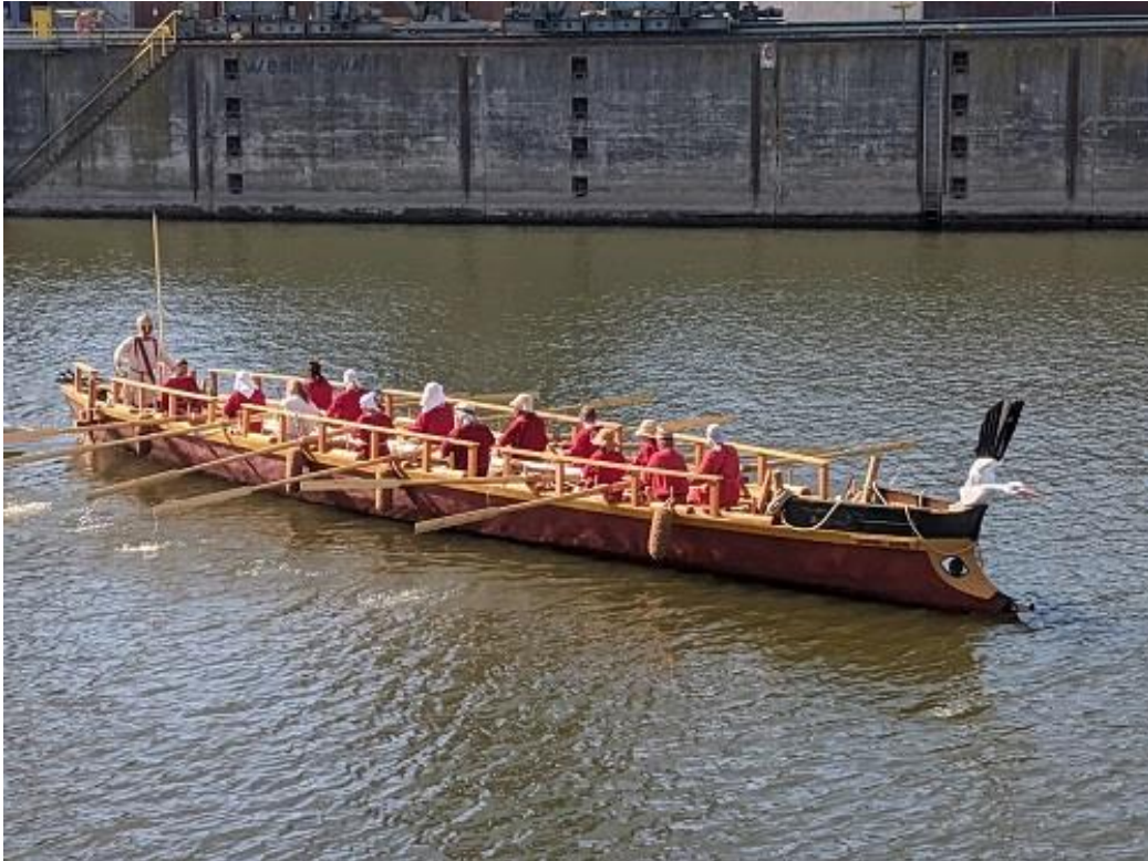
Replika římské lodi Danuvina Alacris