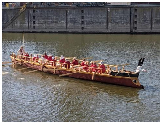
Replika římské lodi Danuvina Alacris