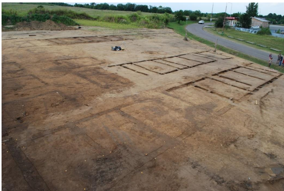
Pohled z ptačí perspektivy na terénní výzkum Hradiska u Mušova