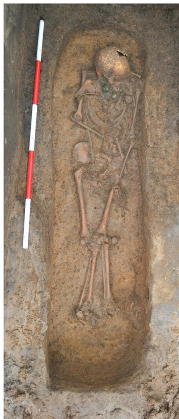
Kresebná a fotografická dokumentace hrobu „vinořské princezny“ Dokumentace ÚPA a ARÚ Praha