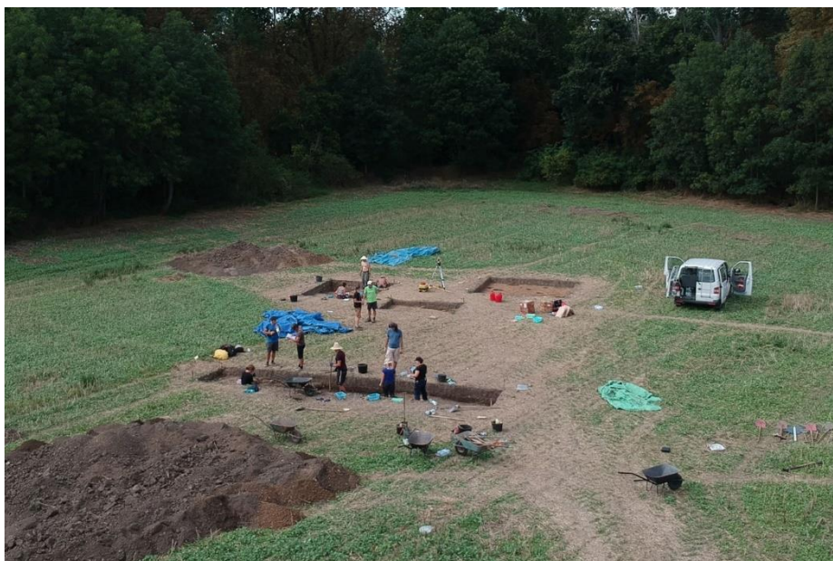
Pohled z ptačí perspektivy na terénní výzkum Hradiště v Praze – Vinoři