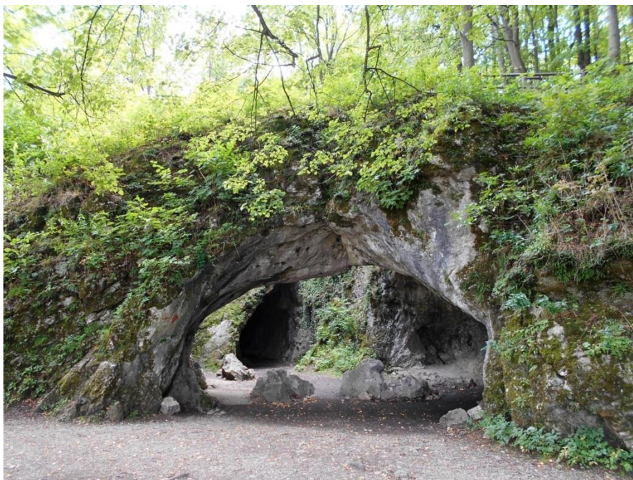
Jeskyňe Šipka u Štramberka