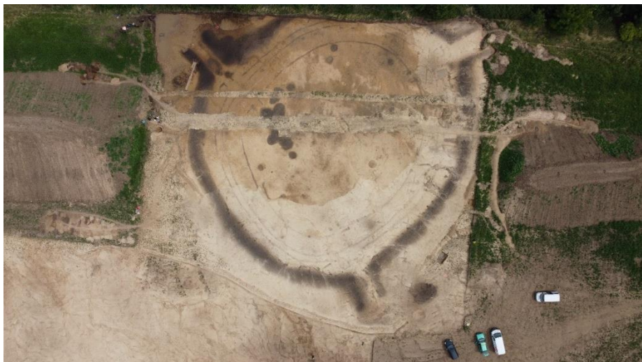
Pohled z ptačí perspektivy na terénní výzkum neolitického rondelu v Praze-Vinoři