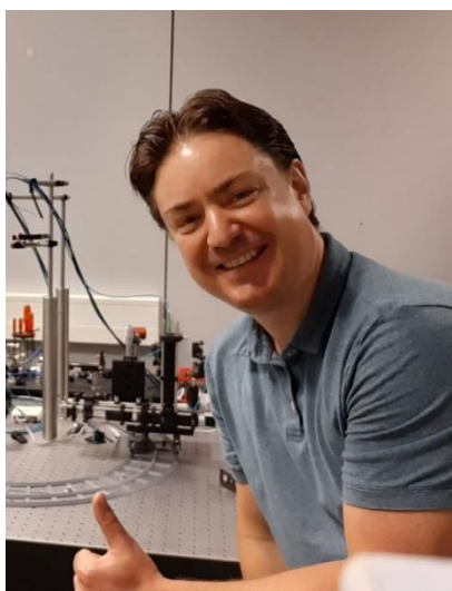
Tomáš Čížmár