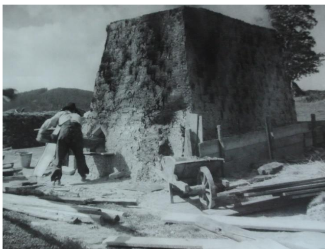
Domácí pálení cihel na Horní Bečvě, 1951.