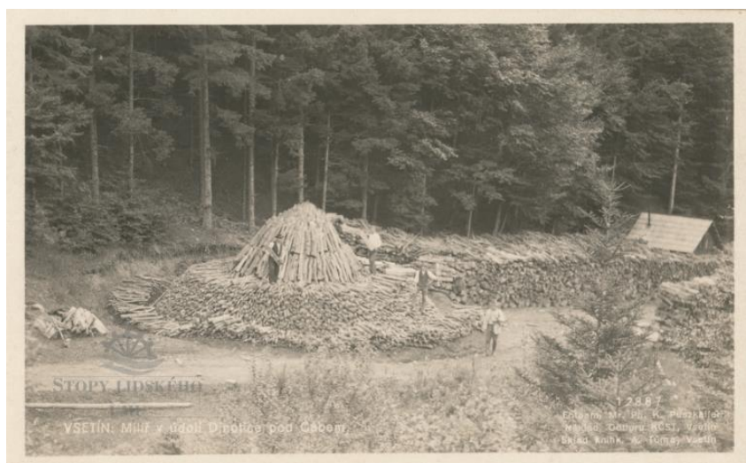
Mlýň v údolí Dinotice pod Cábem