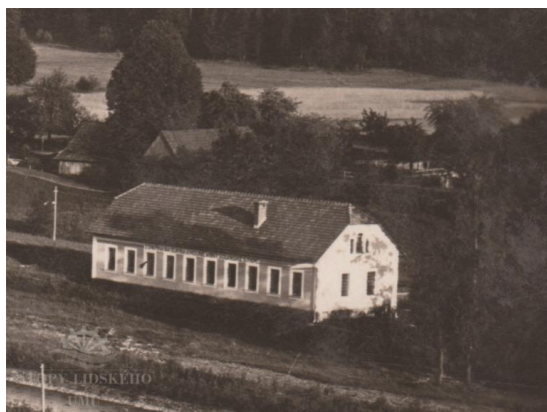
Valcha na výrobu sukna, Prostřední Bečva, první třetina 20. století