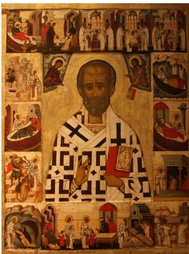
Sv. Mikuláš a scény z jeho života