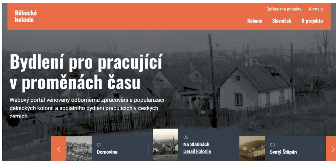
Hlavní stránka webu