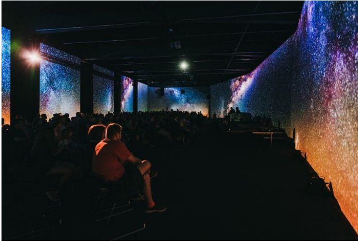
Keplerův sál s 360° obrazovkou, ve kterém se budou pořádat některé přednášky a diskuse.