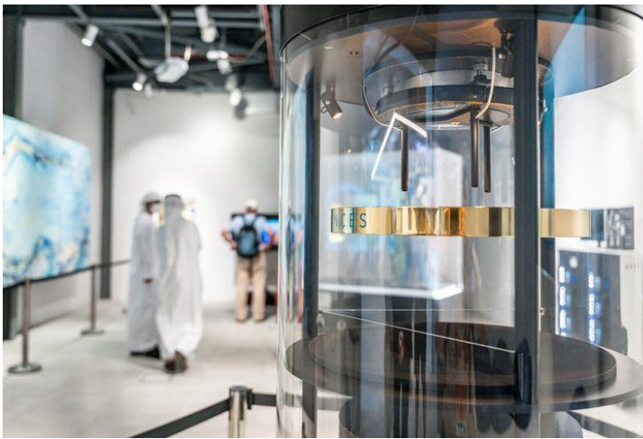
Setrvačnicka na EXPO v Dubaji