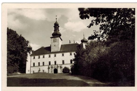
Zámek Třešť na archivní pohlednici