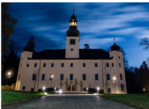
Zámek Třešť – snímek po rekonstrukci