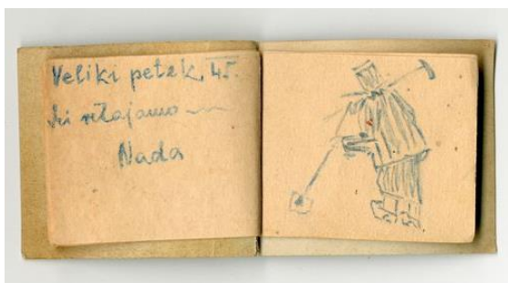
Zápis v památníku vězeňkyně pobočné koncentračního tábora Svatava