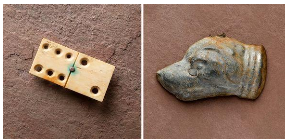
I za dráty zůstává člověk hřavou a tvořivou bytostí. Kámen ze hry domino a rukodělný cínový odlitek ve tvaru psí hlavičky ze zajateckého tábora Rolava