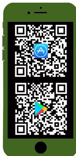
Návštěvníky druhoválečného důlního závodu a zajateckého tábora Rolava nově provede aplikace pro chytré telefony.