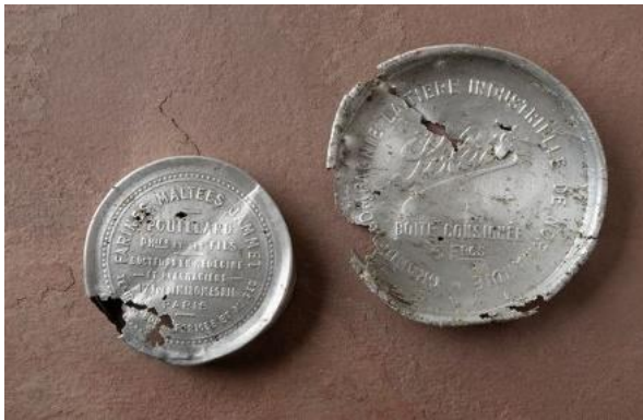
Obaly od výživných potravin zaslaných v balíčcích Červeného kříže francouzským zajatcům tábora Rolava