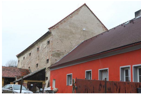
V nacistický tábor mohly být přeměněny i zcela nenápadné stavby; sýpka v Městě Holýšově, která sloužila jako ubytování vězeňů koncentračního tábora.