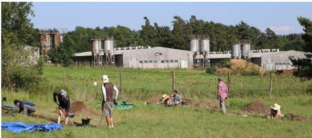
Momentka z výzkumu romského koncentračního tábora v Letech u Písku