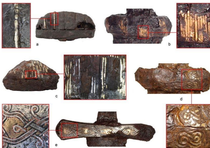
Detaily různých typů výzdoby jílců raně středověkých mečů z českého území (výběr)

Národní muzeum jiri.kosta@nm.cz +420 724 941 147