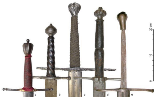
Tzv. rychtářské meče z konce 15. až 1. poloviny 16. století dokumentované v českých sbírkách (výběr). Česká města tyto meče často objednávala v Pasově.