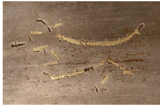
Pasovský vlk – značka na čepeli meče z konce 15. století