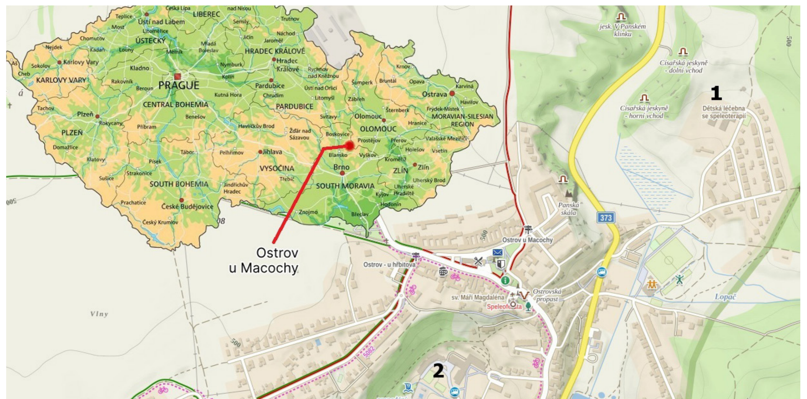
Poloha současné (1) a původní (2) budovy Dětské léčebny se speleoterapií v Ostrově u Macochy

V průběhu projektu bylo analyzováno chemické složení a velikostní distribuce aerosolů odebraných ze vzduchu v lokalitě současné budovy léčebny a u bývalé budovy umístěné v centru obce. Výsledky potvrdily vyšší úroveň znečištění vzduchu v zimním období než v letním období a zároveň mnohem nižší koncentrace aerosolů v současné lokalitě léčebny než na původní. Jako hlavní zdroje znečištění vzduchu v zimním období byly identifikovány emise ze spalování dřeva a uhlí při vytápění domácností jak přímo v Ostrově, tak v blízkých obcích. V letním období se na znečištění podílely jak emise vzniklé při spalování tuhých paliv (zejména ve večerních hodinách), tak emise z dopravy.