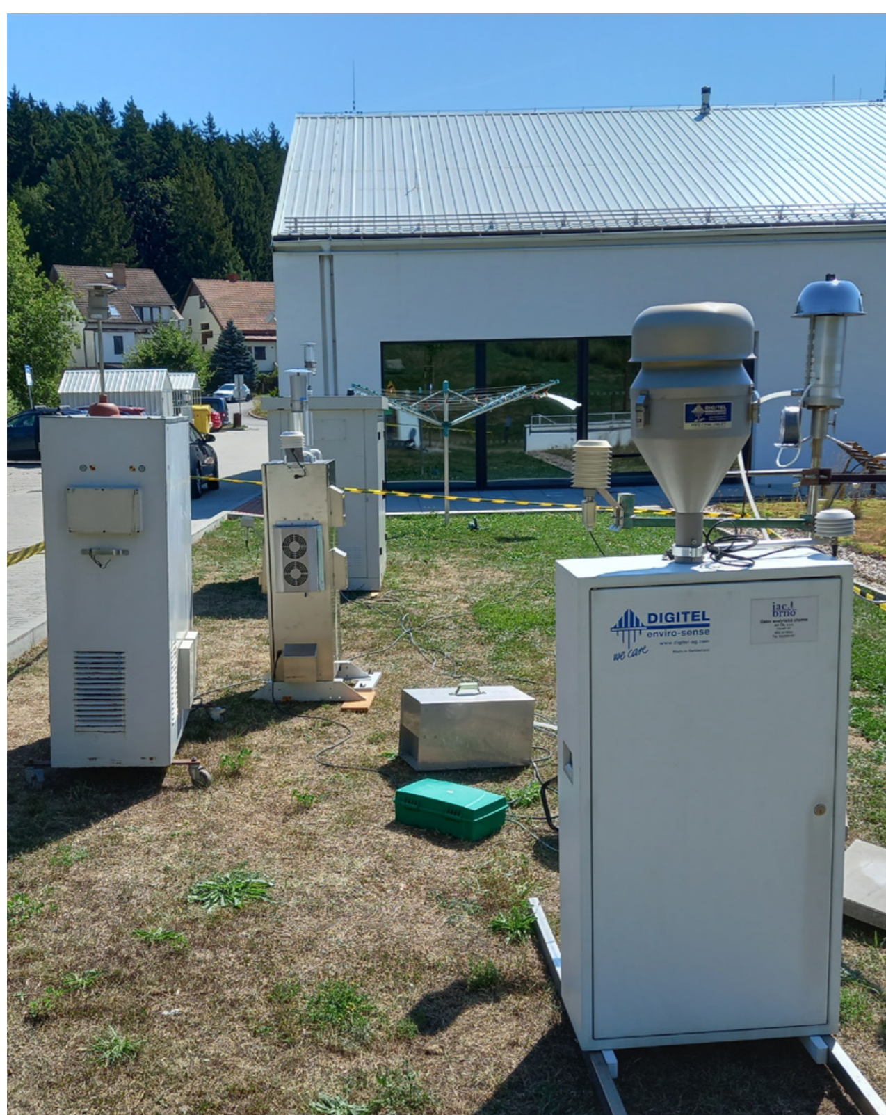
Aparatura pro vzorkování aerosolů