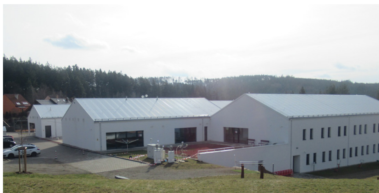
Stanoviště pro vzorkování aerosolů během letní kampaně 2024 u současné budovy Dětské léčebny