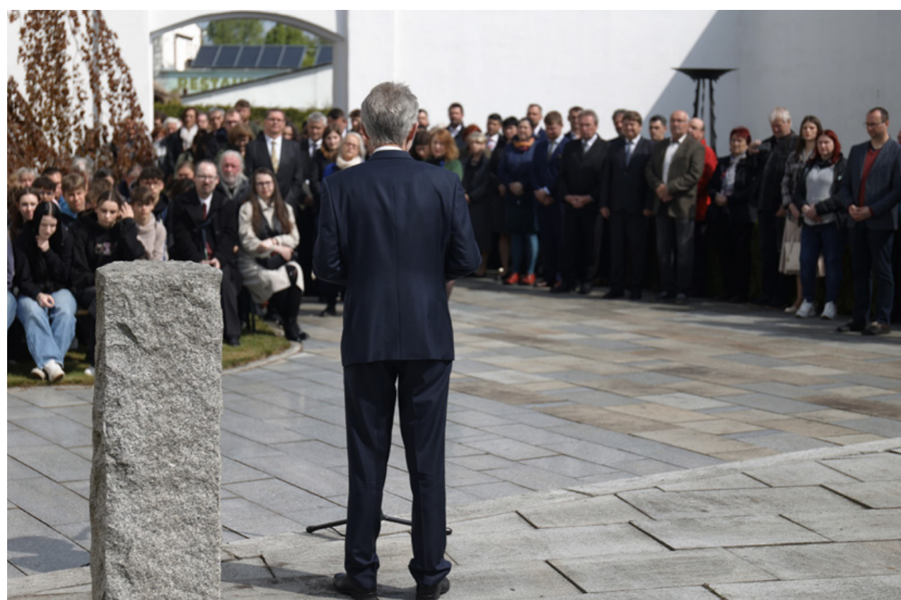
Slavnostní otevření 7. května 2025 se konalo na místě pietního prostoru za přítomnosti předsedy Senátu ČR Miloše Vystrčila

„Sousedé ve válce“ dnes slouží školám, obyvatelům i návštěvníkům města a otevírají prostor k přemýšlení o tom, jak dávno poražené totalitní režimy stále ovlivňují naši současnost.