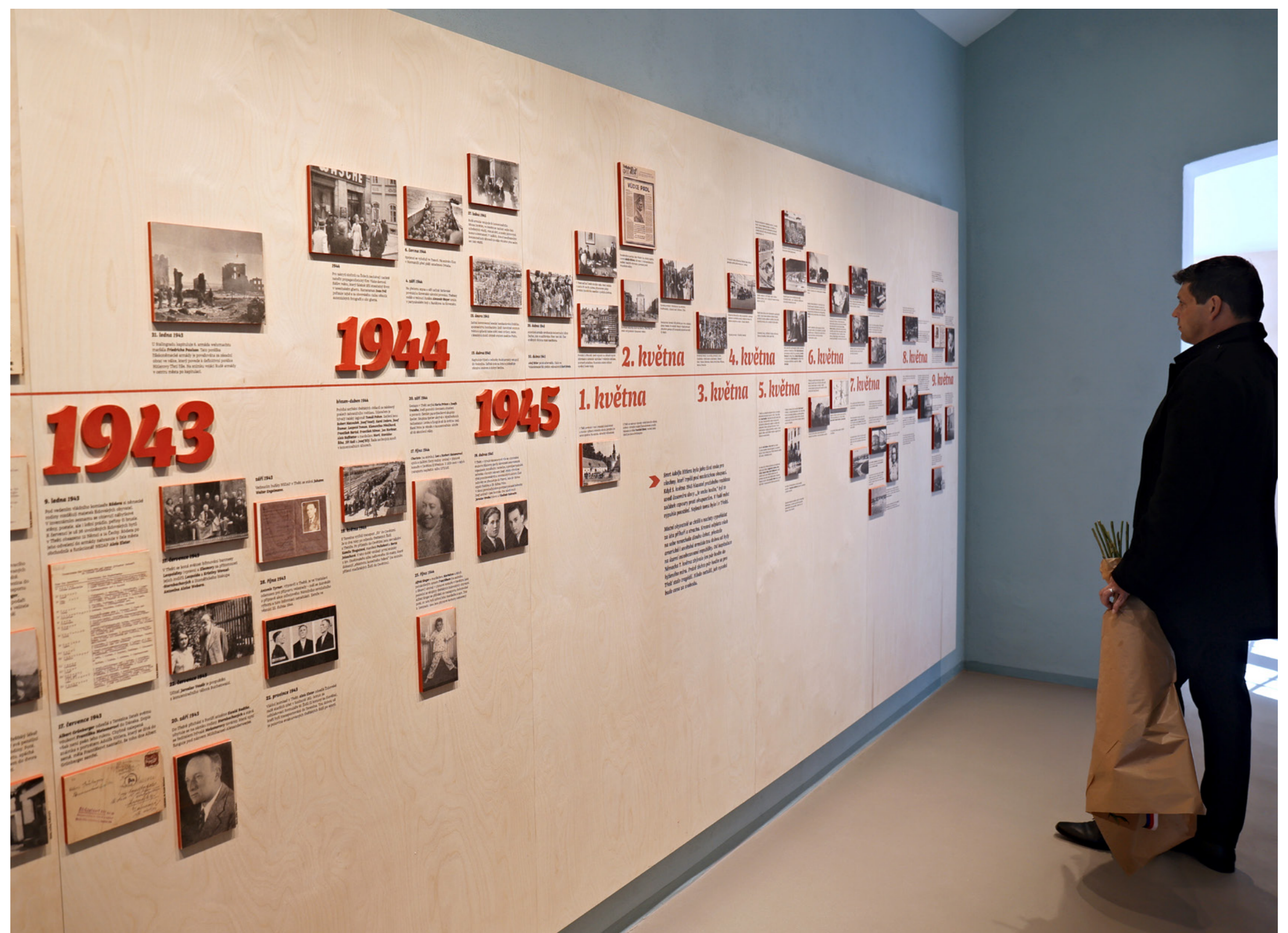
Unikátní sbírky fotografií z archivů a soukromých sběratelů umožnily vytvoření poutavé stálé výstavy i monografie