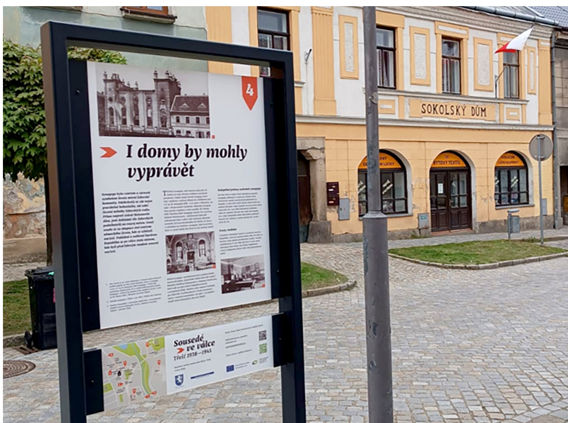
Naučná stezka propojuje významná místa maloměsta, včetně zámeckého Konferenčního centra Akademie věd ČR