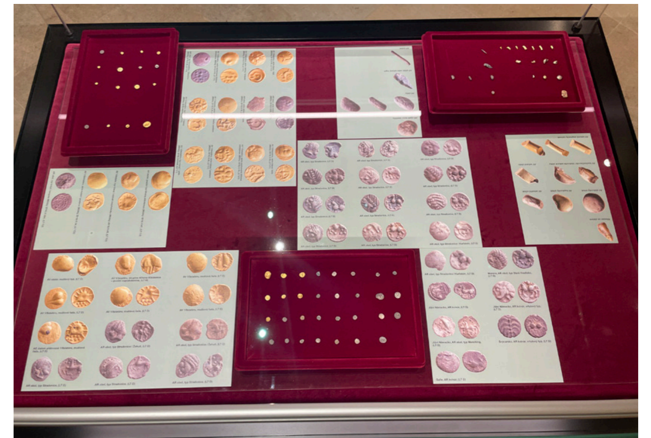
Výstava Nejasná zpráva o Keltech na severním Plzeňsku , výběr nálezů mincí a sekaných ingotů, zlato a stříbro, 3.–1. století př. n. l.