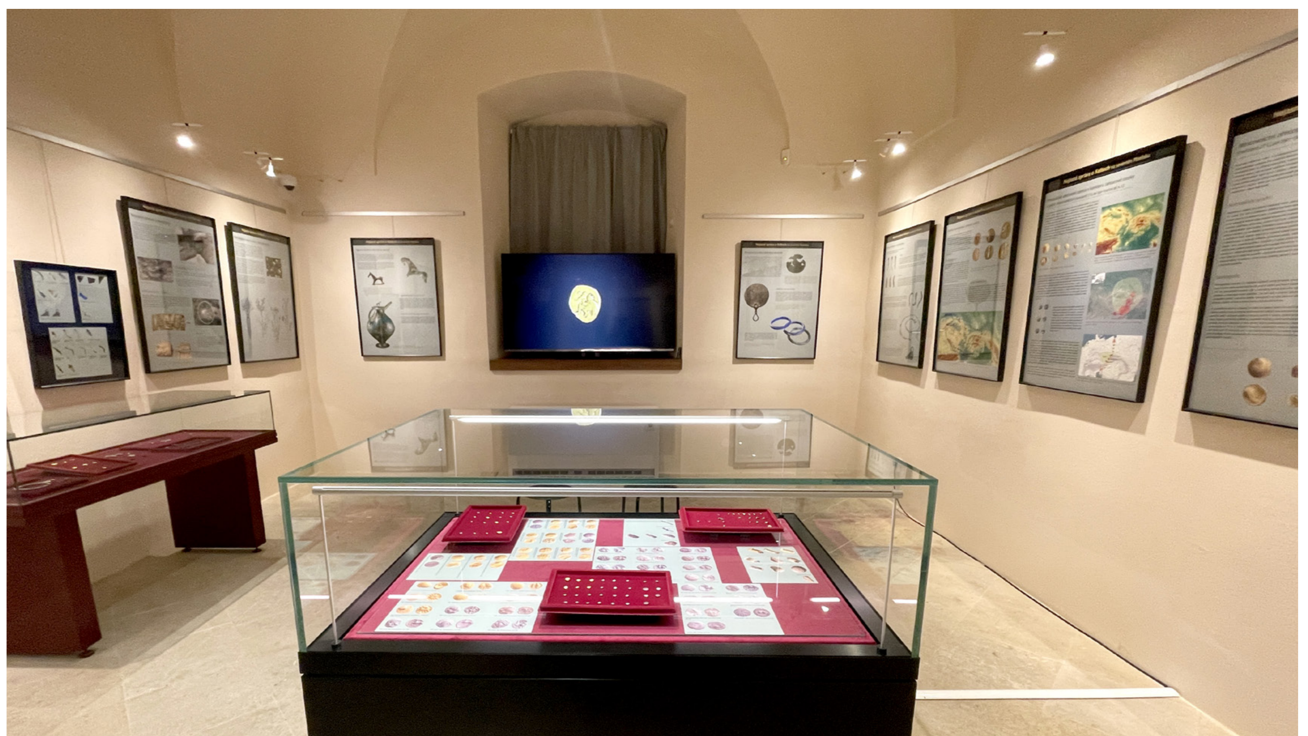
Pohled do výstavy Nejasná zpráva o Keltech na severním Plzeňsku , Mariánská Týnice, 3. 9. – 30. 11. 2025