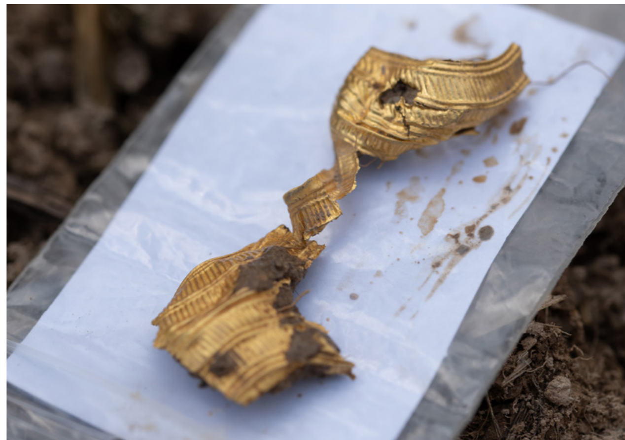
Nálezový stav zlatého plechového šperku, 5. století př. n. l.

Cílem terénního výzkumu dosud neznámé archeologické lokality byla záchrana mimořádně cenného archeologického naleziště před devastujícími nelegálními průzkumy. Stovky nálezů s vysokou uměleckou i kulturně-historickou hodnotou obohatily muzejní sbírky Plzeňského kraje, zejména však přinesly klíčová data pro další vědecké zhodnocení a celkovou interpretaci lokality. Díky projektu se podařilo prokázat existenci rozsáhlého obchodního a správního centra s vazbami na mnoho částí tehdejšího keltského světa. Během průzkumu byly nalezeny i starší pohřby (5. století př. n. l.) společenských elit zdejšího regionu. Množství i charakter objevených zlatých předmětů nasvědčuje intenzivní, centrálně řízené exploataci místních zdrojů v posledních pěti stoletích před změnou letopočtu.