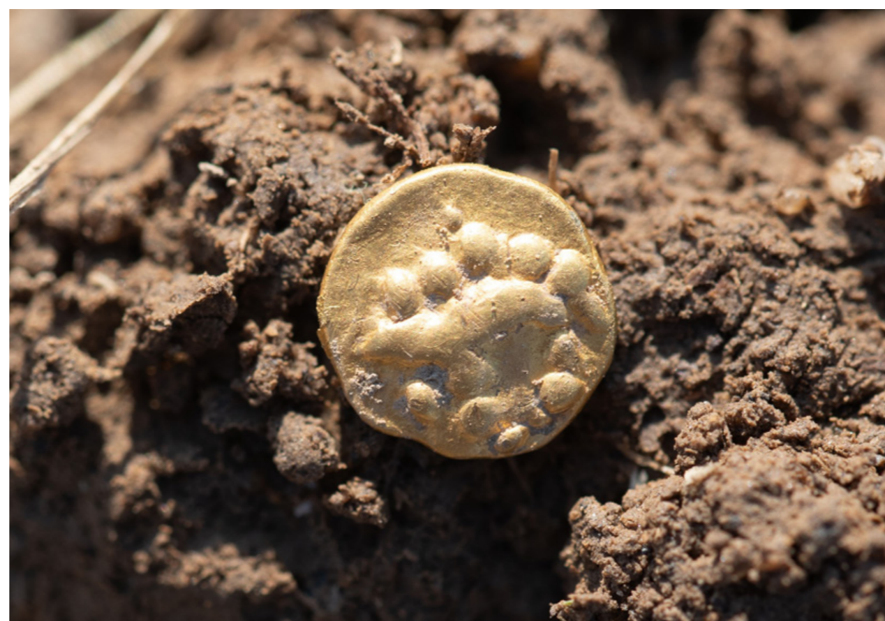
Zlatá mince s vyobrazením kance, 1/8 statéru, ČECHY, Bójové, 3.–2. století př. n. l.