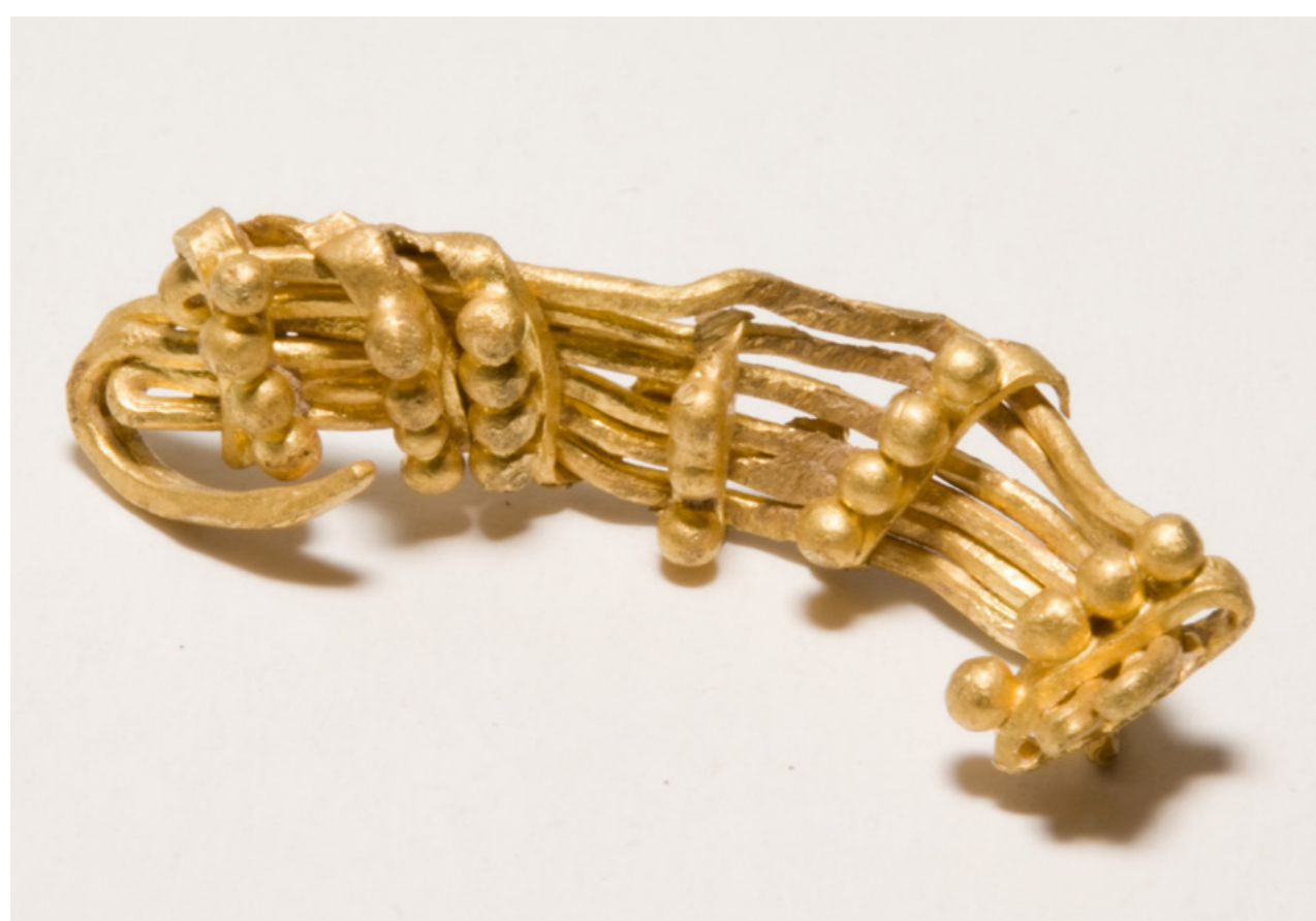
Zlatá náušnice zdobená technikou granulace, 5. století př. n. l.