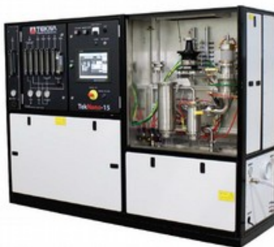
Indukční plazmový systém pro tvorbu nástřiků TEKNA TekSpray 15